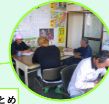
帰社・1日のまとめ