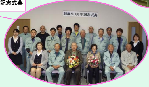
創業50周年記念式典