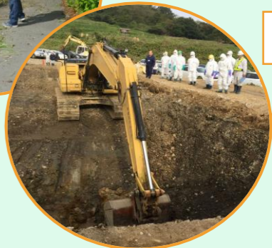
鳥インフルエンザ 防疫対応実地訓練